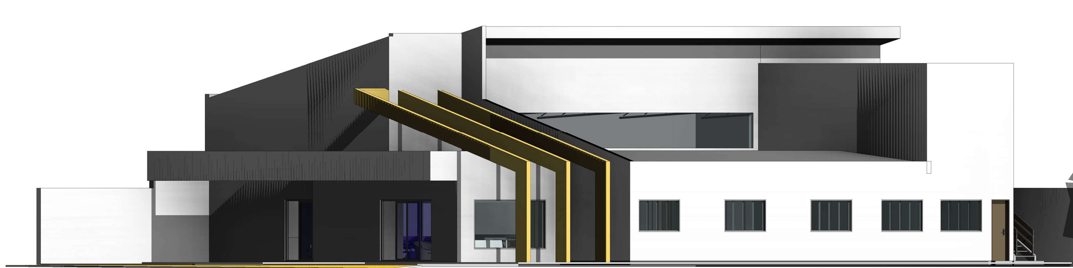
1 PERSPECTIVA ESCALA